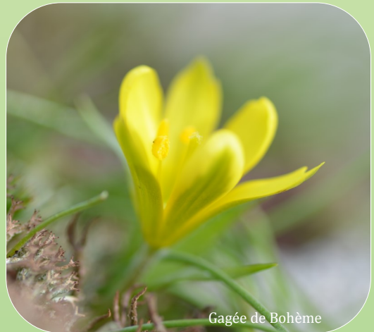
Gagée de Bohème

Vos observations nous intéressent. Le projet est avant tout participatif !